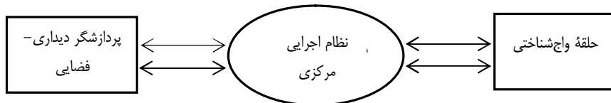
شکل ۳. مدل حافظه فعال/کاری بدلی-هیچ (۱۹۷۴) برگرفته از کارول (۲۰۰۸)

در مورد مقایسه عملکرد حافظه فعال در زبان و موسیقی این پرسش‌ها مطرح می‌شود: عملکرد نظام پردازش اطلاعات یا حافظه فعال در این دو نظام چگونه است؟ آیا شباهت‌ها و تفاوت‌هایی دیده می‌شود؟ آیا هر دو از منابع حافظه‌ای یکسان و مشابه استفاده می‌کنند؟ چه ویژگی‌ها، منابع و بخش‌های مشترکی در پردازش دو نظام دخیل‌اند؟ برای پاسخ به این پرسش‌ها عملکرد دو نظام مدل حافظه فعال بدلی-هیچ ۱ و حافظه فعال نحوی ۲ در نظام‌های شناختی زبان و موسیقی در ادامه بررسی می‌شود. مدل حافظه فعال بدلی-هیچ (۱۹۷۴) شامل مؤلفه‌هایی است که در شکل ۲ نشان داده شده‌است.