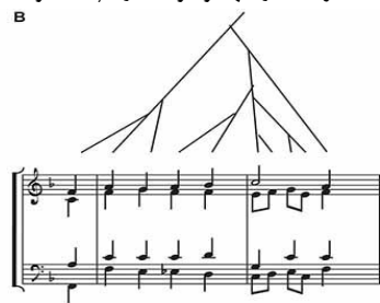
Christus, der ist mein Leben 1st phrase (J.S. Bach)