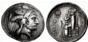
تصویر ۱: (ویسهوفر، ۱۳۷۸: ۷۶)

دودمان پارسی می‌خواستند تبار خود را به پارسیان گذشته‌ای که فرمانروای سرزمینی پهناور بودند برسانند. بغداد در پشت مضروب‌های خود صحنه‌ای که یادآور نگارگری هخامنشی در تخت جمشید است را درج می‌کند. در این نقش وی چون داریوش یکم هخامنشی بر تختی جلوس کرده و در دستان خود یک دست، عصای شاهانه بلند، و چنانکه در بالا اشاره شد در دست دیگر یک گل را نگاه داشته است. احتمالاً هم این سکه چنانکه سلوود ۱ عقیده دارد ضرب همان پارسه و یا شاید استخر بوده باشد که در نزدیکی تخت جمشید نیز قرار هست.