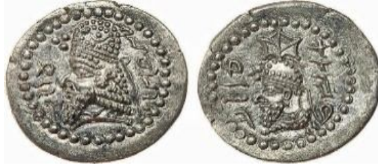
تصویر ۸ ( فریدنژاد و دریایی، ۲۰۲۲: ۵۱؛ حسنی، ۱۳۹۳: ۶۷).

ادعای نولدکه، شباهت چهار نویسه پایانی نام منوچهر با نام گوچهر پیرامون یکی دانستن حاکم روایت طبری با آخرین حاکم دودمان منوچهریان به اندیشه او می‌دارد که پیش از این درگیری‌ها و شورش ساسانیان ارتباط نزدیکی بین دودمان منوچهریان با دودمان ساسانیان وجود داشته است. در هر صورت سرآخر شاهک‌های ساسانی، پسران بابک، شاپور و اردشیر از خط تکمیل یافته پارسیگ برای کل پادشاهی خود استفاده نمودند. پس مشاهده نمودیم تکامل خط پارسیگ یا پهلوی ساسانی در این زمان که مقارن با اواخر عصر اشکانی است صورت گرفته است (شرو، ۲۰۰۹: ۱۹۶).