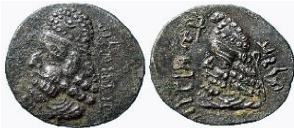
تصویر ۷ (سرفراز و آورزمانی، ۱۳۹۵: ۸۱؛ امینی، ۱۳۸۹: ۱۱۶)

در سکه دیگری از منوچهر شاهی دیگر (تصویر شماره ۶) علی رغم آنکه خط سکه بسیار مخدوش و خوانش آن دشوار است اما هنوز ریخت آرامی نویسه‌هایی چون L در واژه 'MLK' در این مضروب‌ات دیده می‌شود. نکته آن که نویسه L در پارسیگ هم ریخت آرامی خود را حفظ نموده و در واژگان هزوارش و غیرهزوارش پهلوی صورت L نوشته و ۲ خوانده می‌شود. چنانکه می‌دانیم در ایرانی باستان L جز در لغات دخیل وجود نداشته است (ابوالقاسمی، ۱۳۷۸: ۷) و گروه rd از فارسی باستان در فارسی میانه زرتشتی به L تبدیل شده است (ابوالقاسمی، ۱۳۷۸: ۱۸). پس مشاهده می‌شود در سیر خط پارسیگ هم، نویسه L تقریباً ریخت کهن خود که ماخوذ از آرامی است را حفظ نموده است (ابوالقاسمی، ۱۳۷۳: ۱۵۸). ۳- دسته سوم مسکوکاتی از حکام پارسی که خط به کار رفته در آنها دیگر عملاً تغییر یافته و در شکلی نو تثبیت گشته است. متن سکه حاکم پارسی که جملگی نویسه‌ها به پارسیگ است به شرح زیر می‌باشد: