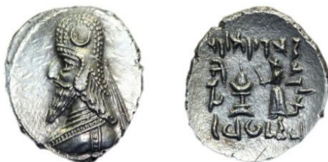
تصویر ۴ (فریدنژاد و دریایی، ۲۰۲۲: ۴۸؛ سرافراز و زمانی، ۱۳۹۵: ۸۰).

در دو سکه بعدی که متن سکه به شرح زیر است: (تصویر شماره ۶ و ۵)