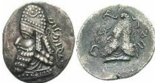
تصویر ۶ (سرفراز و آورزمانی، ۱۳۹۵: ۸۱؛ امینی، ۱۳۸۹: ۱۱۶)

در سکه دیگری از منوچهر شاهی دیگر (تصویر شماره ۶) علی رغم آنکه خط سکه بسیار مخدوش و خوانش آن دشوار است اما هنوز ریخت آرامی نویسه‌هایی چون L در واژه 'MLK' در این مضروب‌ات دیده می‌شود. نکته آن که نویسه L در پارسیگ هم ریخت آرامی خود را حفظ نموده و در واژگان هزوارش و غیرهزوارش پهلوی صورت L نوشته و ۲ خوانده می‌شود. چنانکه می‌دانیم در ایرانی باستان L جز در لغات دخیل وجود نداشته است (ابوالقاسمی، ۱۳۷۸: ۷) و گروه rd از فارسی باستان در فارسی میانه زرتشتی به L تبدیل شده است (ابوالقاسمی، ۱۳۷۸: ۱۸). پس مشاهده می‌شود در سیر خط پارسیگ هم، نویسه L تقریباً ریخت کهن خود که ماخوذ از آرامی است را حفظ نموده است (ابوالقاسمی، ۱۳۷۳: ۱۵۸). ۳- دسته سوم مسکوکاتی از حکام پارسی که خط به کار رفته در آنها دیگر عملاً تغییر یافته و در شکلی نو تثبیت گشته است. متن سکه حاکم پارسی که جملگی نویسه‌ها به پارسیگ است به شرح زیر می‌باشد: