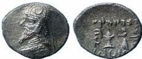
تصویر ۳ (فریدنژاد، دریایی، ۲۰۲۲: ۴۸؛ سرافراز، زمانی، ۱۳۹۵: ۸۰)

آرامی به پارسیگ است. (ویسهوفر، ۱۳۷۸: ۸۵) دو نویسه A نیز یکی در پایان واژه ملکا MLK' و دومی در نویسه دوم نام داریو d'ryw را به همین شکل گذار از آرامی به پارسیگ می‌توان در نظر گرفت که البته به ریخت پارسیگ نزدیک تر است در اینجا فزون بر نویسه A شکل پنج نویسه w-y-r در نام داریو d'ryw، نویسه K در واژه MLK' و نویسه t در نام وادفرداد wtprdt مابین این دو خط و باز هم در حال گذار از آرامی به پارسیگ است. اما نویسه d در نام داریو d'ryw و وادفرداد wtprdt سیر تحول خود را طی کرده و کاملاً در ریخت پارسیگ خود نوشته شده است (ابوالقاسمی، ۱۳۷۳: ۱۵۸). ذکر این نکته نیز ضروری است که گفته شود در کلیه سکه‌های به دست آمده از داریو گذار و سیر تحول خط کاملاً مشهود است. بدین شکل که در سکه‌ای (شماره سوم) متن کلی و نویسه‌ها به آرامی نزدیکتر و در سکه‌ای دیگر (شماره چهارم) خط به پارسیگ نزدیک شده است. این نکته بازه زمانی ضرب این سکه‌ها را نیز نشان می‌دهد بدین شکل که سکه با متن نزدیک به آرامی قدیمی‌تر و سکه نزدیک به پارسیگ در سال‌های بعدتر ضرب شده و جدیدتر است چرا که مورد سیر تحول خط قرار گرفته‌اند